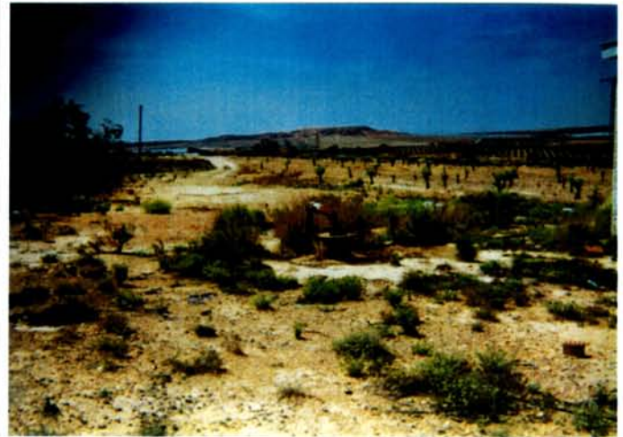
Fotografía de detalle

DESCRIPCIÓN: Es un sondeo de 350 m de profundidad que fue perforado en 1986. Se desconocen las características de perforación y acondicionamiento, ya que no fue posible visitar la captación.