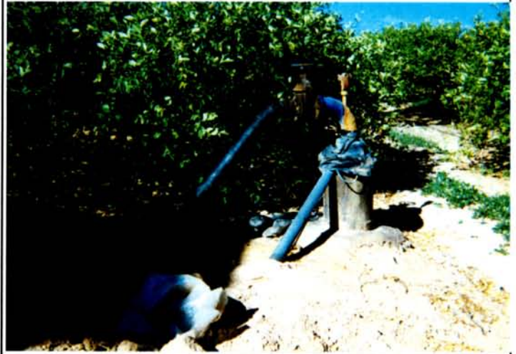
Fotografía de detalle

DESCRIPCIÓN: Es un sondeo de 420 m de profundidad perforado en 1976. Está cementado en sus primeros 300 m, para aislar el tramo acuífero del Plioceno (areniscas). Está emboquillado con tubería de 500 mm de diámetro y con tubería de impulsión de 150 mm de diámetro. El agua se conduce a una balsa desde la que se riega.